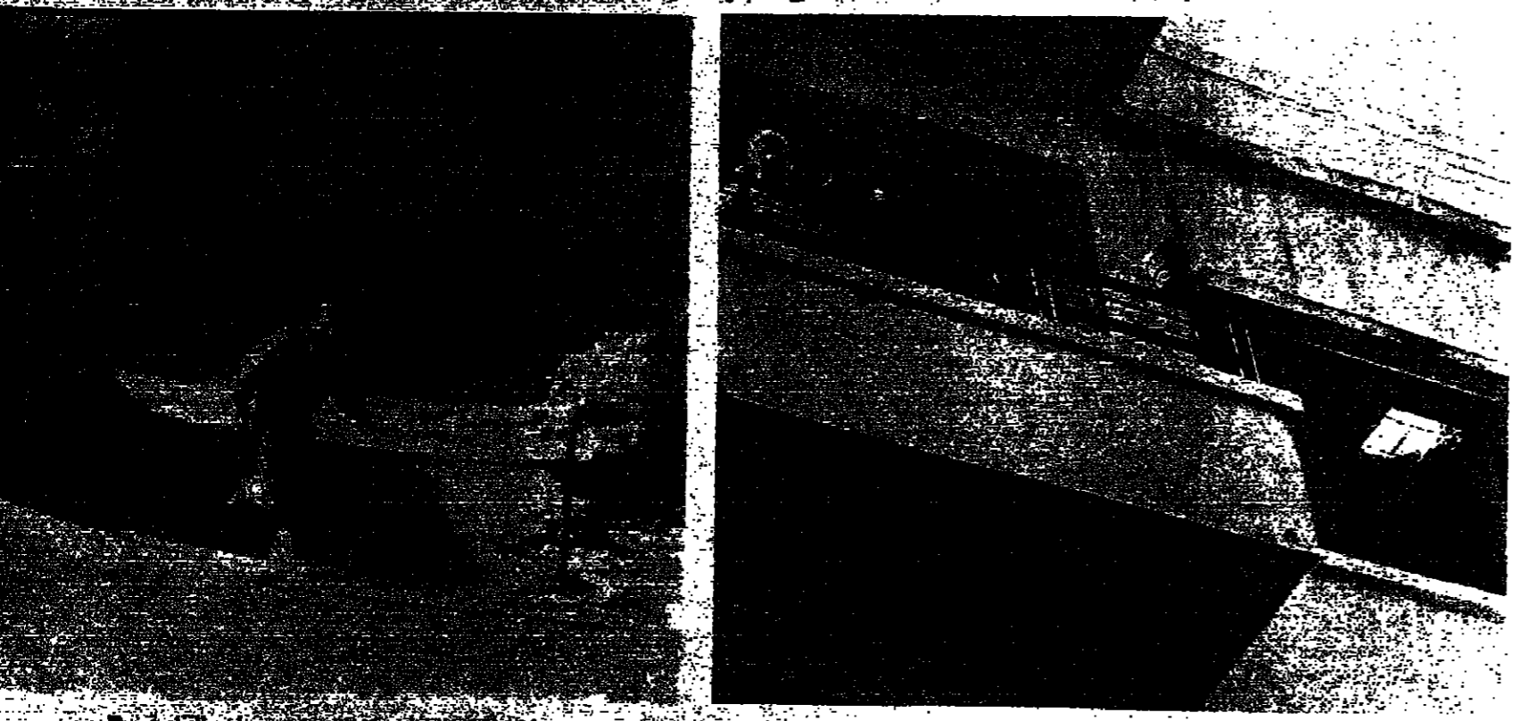
■ غرفة ( الى اليمن ) احييت سابقها بقبعة